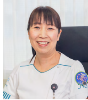
近森会グループ 統括看護部長あいさつ