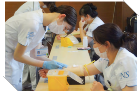
▲ 点滴・静脈注射 実践演習