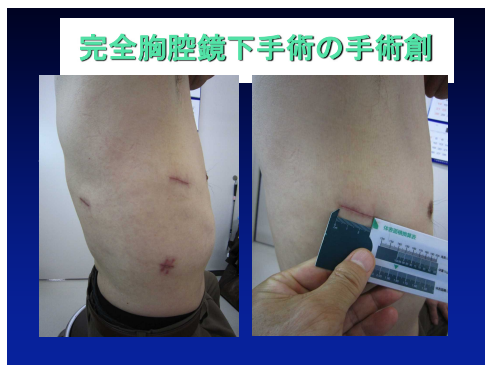
図1 胸腔鏡下肺癌手術の手術創